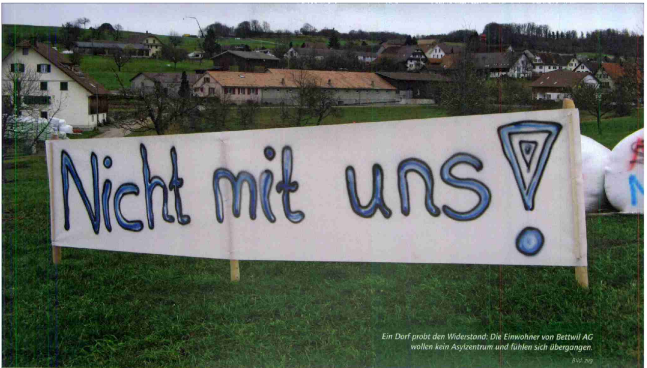
Ein Dorf probt den Widerstand: Die Einwohner von Bettwil AG wollen kein Asylzentrum und fühlen sich übergangen.

Dorf geschehen soll. Tappolet erinnert sich an die damalige Gemeindeversammlung: «Zur Auswahl standen ein Rehabilitationszentrum für Drogenabhängige oder das Durchgangszentrum für Asylbewerber. Das Verdikt fiel relativ klar zugunsten der Ausländer aus.» Bereut hat er die Entscheidung nie. «95 Prozent der Asylsuchenden sind liebenswerte